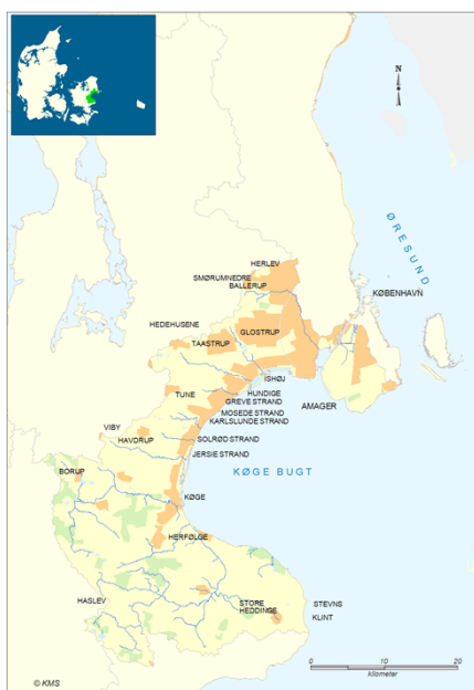
Figur 1. Statens vandplan for Køge Bugt

Indledningsvis er det vigtigt at fastslå, at ansvaret for kystfarvande og det åbne hav er et nationalt anliggende og at kommunerne ikke har hverken myndighedsansvar eller planlægningsansvar. Det eneste område kommunerne har ansvar for er badevandsmålinger. Forud for Kommunalreformen i 2007 havde amterne ansvar for recipientkvalitetsplanlægning i både vandløb, søer og kystvande, herunder overvågning af miljøtilstanden. Denne opgave blev med kommunalreformen overført til staten. Statens opgaver på havet er fordelt på flere ministerier: Miljøministeriet med miljøstyrelsen og kystdirektoratet, Erhvervsministeriet, Transportministeriet og Fødevarer- og fiskeriministeriet.